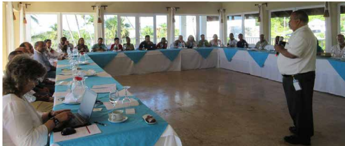
Participantes Mesa Turística Samaná.

Samaná y su península poseen innumerables riquezas naturales, paisajes coloridos, cascadas, arrecifes de coral, cuevas, manglares que generan motivaciones de visitación. Destacándose el Parque Nacional Los Haitises, el Salto El Limón y